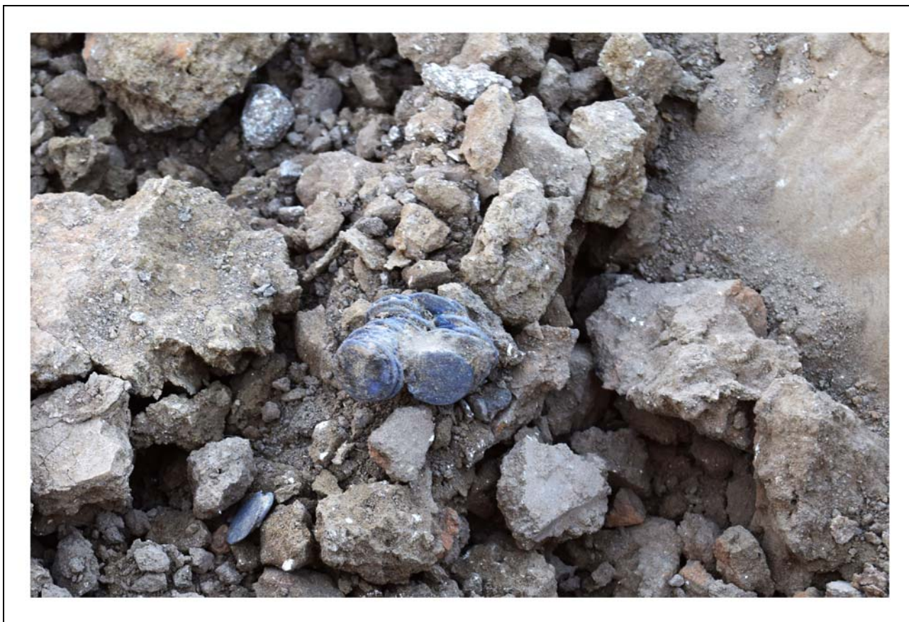
Фото 2. Слипшиеся монеты Пятого клада, найденные в раскопе № 3 в помещении № 5.

Клад был обнаружен в приповерхностном слое земли (на глубине 10 см) после того, как курхана была убрана. Монеты клада представляли собой несколько слипшихся комочков и несколько отдельных экземпляров, всего — 42 данга (Фото 2).