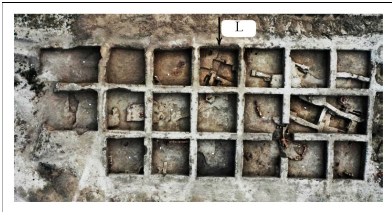
Фото 3. Вид сверху на раскоп 1 в 2022 г. на городище Сарайчик. Отмечен сектор L, где был найден Седьмой клад.